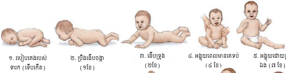
១. របៀបគេងរបស់ទារក (ទើបកើត) ២. ប្រឹងងើបចង្កា (១ខែ) ៣. ងើបទ្រូង (២ខែ) ៤. អង្គុយពេលមានគេទប់ (៤ខែ) ៥. អង្គុយដោយខ្លួនឯង (៧ខែ)