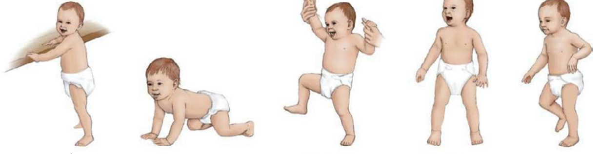
៦. ឈរតាងសង្ហារឹម (៩ខែ) ៧. រាវ (១០ខែ) ៨. ងើបប្រសិនបើមានគេកាន់ដៃ (១១ខែ) ៩. ឈរដោយខ្លួនឯង (១១ខែ) ១០. ឈរដោយខ្លួនឯង (១២ខែ)

ការអភិវឌ្ឍបំណិនចលនា តាមរយៈការពិនិត្យមើលលំដាប់លំដោយនៃការអភិវឌ្ឍរបស់ទារក ដែលគេអាចព្យាករដឹងបាន៖